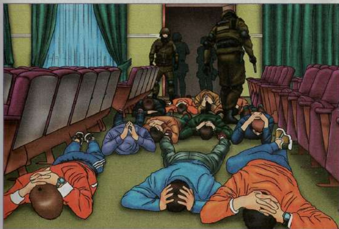
При штурме следует занять горизонтальное положение