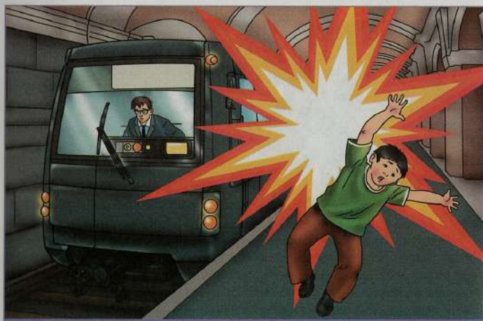
Взрыв в вагоне метро

Терроризм на криминальной основе проявляется в организации заказных убийств, вооружённой борьбы между преступными группировками и т. п.