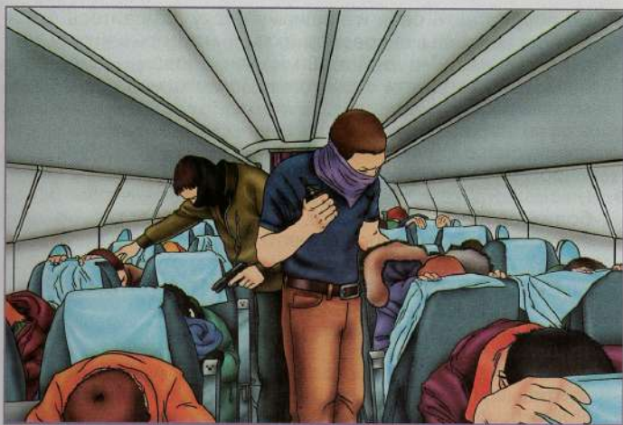
Террористы удерживают заложников в салоне самолёта

В случае силового освобождения заложников (при штурме спецподразделением):