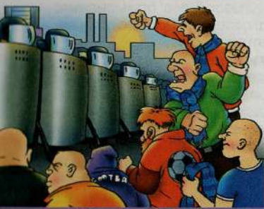
Демонстрация, которая переросла в хулиганские действия и беспорядки

Экстремистскими считаются материалы в виде документов или информации на различных носителях, призывающие, обосновывающие или оправдывающие экстремистские идеи и деятельность. Признаками экстремистских материалов являются содержащиеся в них сведения, обосновывающие национальное или расовое превосходство, оправдывающие военные или иные преступления, направленные на незаконное ущемление интересов либо частичное или полное уничтожение какой-либо социальной, расовой, национальной или религиозной группы. Подобные материалы служат инструментом изменения сознания человека с целью вовлечения его в экстремистскую деятельность. Производство, хранение и распространение экстремистских материалов влечёт за собой ответственность перед законом.